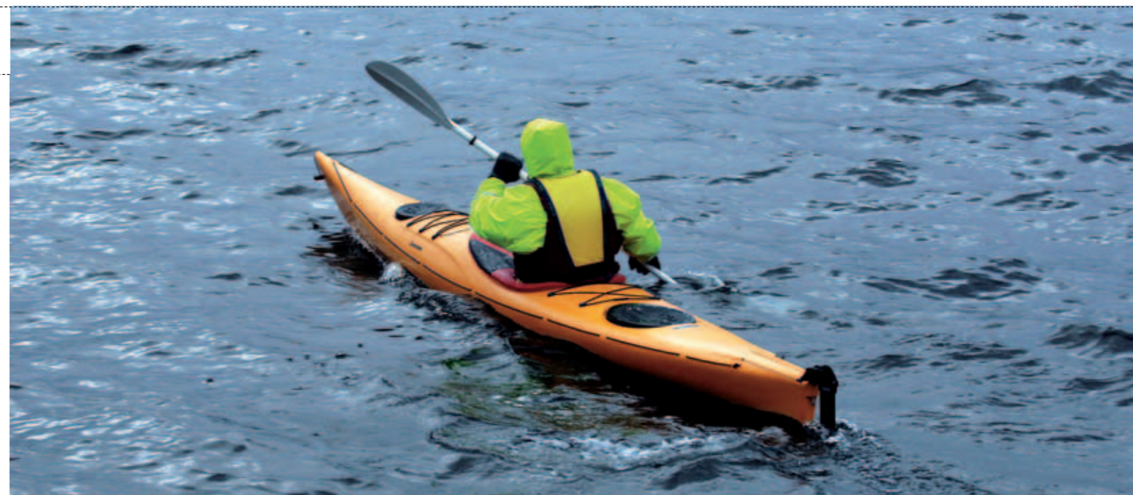
Det foreløpig siste tilskuddet i Haslefamilien er flott fra alle vinkler.

I liket med de aller fleste kajaker laget i dette plastmaterialet er også testbåten av det litt tyngre slaget. Sammenlignet med glassfiberbåter, og i særdeleshet karbonbåter, merkes vekten spesielt når man bærer den alene. De som ikke har tatt en ekstra dose Møllers tran må ta i så det merkes når kajakken skal opp på biltaket. Det er prisen man må betale for å kunne glede seg over en båt som tåler ufattelig store påkjenninger. Skulle båten falle ned fra biltaket og du ikke klarer å legge den på stativet ved første forsøk, så er det bare å prøve igjen. Den har garantert ikke fått noen skader! Mange personer er villige til å løfte disse ekstra kiloene når det belønnes med manglende angst for at båten